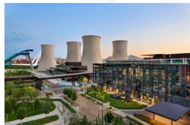
打卡新地標『首鋼園』

潭柘寺 (指定賞花日期: 3月下旬-4月中: 賞玉蘭花) ▶ 皇家琉璃官窯 ▶ 駝鈴古道模式口 (感受京西慢時光) ▶ 首都文化新地標『首鋼園』