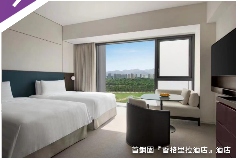
首鋼園『香格里拉酒店』酒店

※ 專業貼心服務-全程食住玩安排妥善、預留充足自由活動時間令團友盡情享受 ※ 【當地專屬配車，由經驗充足的服務人員同行下，讓您體會一個舒適安心的旅程】