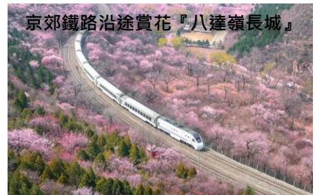
京郊鐵路沿途賞花『八達嶺長城』

歷經明朝及清朝24位皇帝，是世界上保存規模最大的宮殿型建築，為中國國家5A級旅遊景點，並入選世界文化遺產。